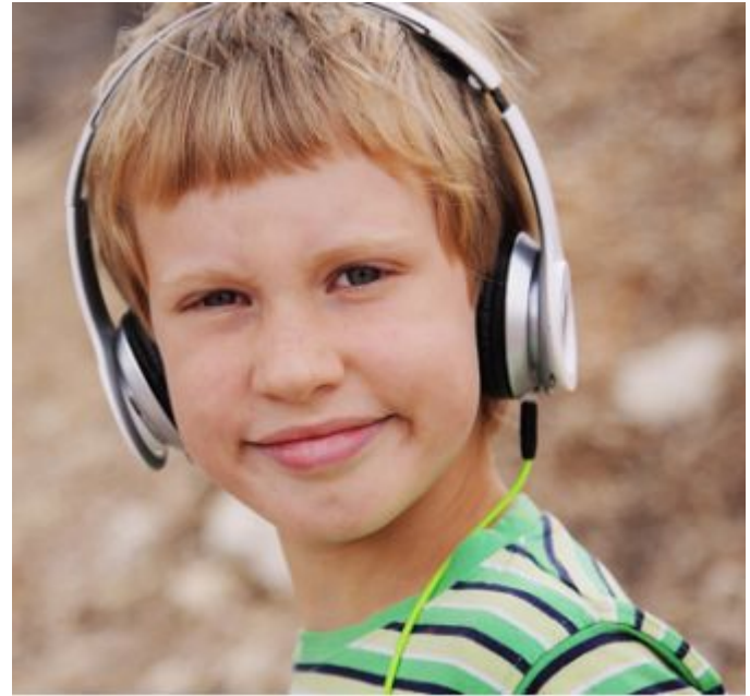
Autismi ei ole tämä poika