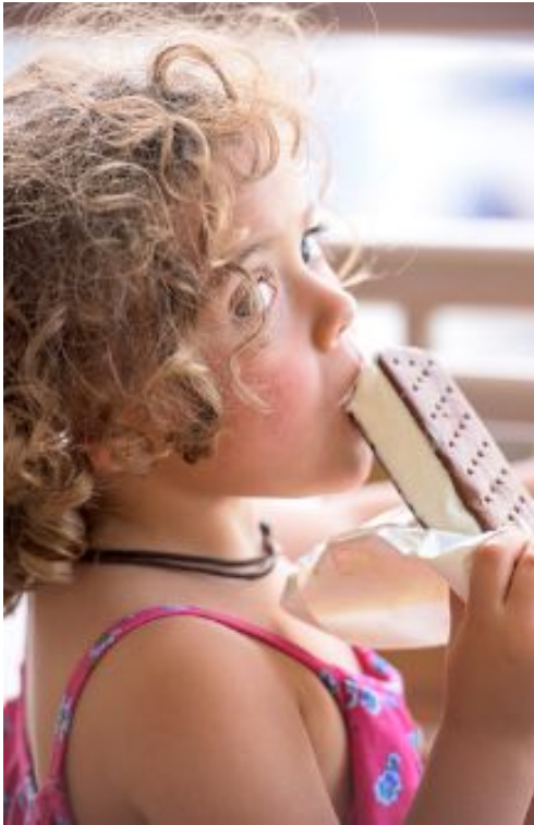
Autismi ei ole tämä tyttö