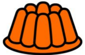
KAKKU ON VALMIS