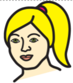
NYT HIUKSENI OVAT SIISTIT