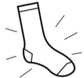
SUKKA ON PUHDAS