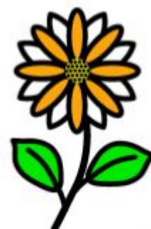
ODOTAN ETTÄ KUKKA KASVAA