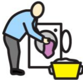
PESEN SUKAN PESUKONEESSA