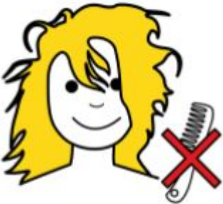
HIUKSENI OVAT TAKKUISET