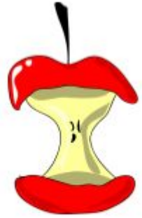
OMENA JOTA ON PURAISTU