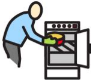
LAITAN KAKUN UUNIIN