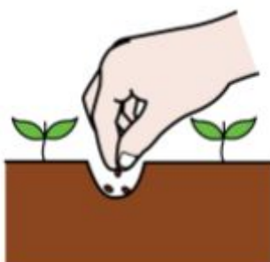
KYLVÄN KUKAN SIEMENET KUOPPAAN