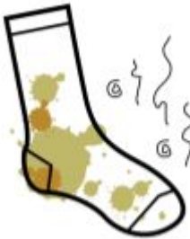
SUKKA ON LIKAINEN